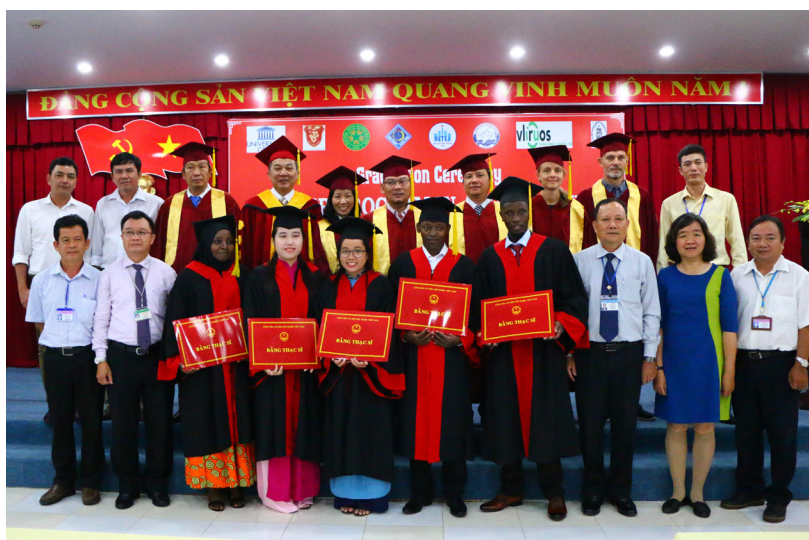
Ảnh lưu niệm tại buổi lễ.

Với thành công bước đầu từ mối quan hệ hợp tác giữa Trường ĐHCT và các đối tác của hai nước, tin rằng chương trình đào tạo thạc sĩ quốc tế ngành Nuôi trồng thủy sản của Trường sẽ ngày càng lan rộng, ghi dấu bước ngoặt trong đào tạo bậc sau đại học của Nhà trường vươn ra khỏi phạm vi quốc gia.