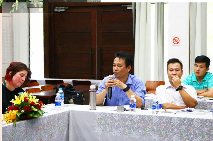
Đại diện các công ty trình bày vấn đề, thách thức với các giáo sư.

tăng cường và mở rộng hoạt động cho các doanh nghiệp và các bên liên quan ở Việt Nam và Bỉ để tạo ra môi trường cho việc nghiên cứu và giáo dục sau đại học. Dựa trên những thành tựu to lớn mang lại từ các dự án đã và đang triển khai, Trường ĐHCT kỳ vọng và tin tưởng mạnh mẽ rằng Nhà trường sẽ tiếp nhận các dự án mới để tiếp tục hợp tác với các giáo sư và chuyên gia Bỉ, góp phần thắt chặt mối quan hệ vốn có giữa Việt Nam và Bỉ ngày càng bền vững.