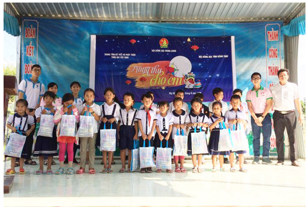
Trung tâm Liên kết Đào tạo - Trường ĐHCT trao tặng 30 suất quà cho các em.

Cũng trong khuôn khổ chương trình Trung thu này, được sự hỗ trợ của Trung tâm Liên kết Đào tạo, Trường ĐHCT, LCHSV Đồng Tháp đã tổ chức chương trình “Ấm tình trăng sen 2018” tại trường Tiểu học Mỹ Hiệp 2, xã Mỹ Hiệp, huyện Cao Lãnh. Chương trình đã trao tặng 350 chiếc lồng đèn và 30 phần quà cho 30 bạn học sinh có hoàn cảnh khó khăn.