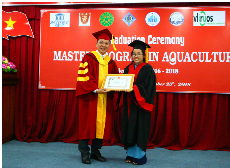
Các Tân thạc sĩ nhận bằng tốt nghiệp.

Phó Hiệu trưởng Trường ĐHCT đã nhiệt liệt chúc mừng thành công của các tân Thạc sĩ, khẳng định lễ trao bằng là một sự kiện đặc biệt dành cho các tân thạc sĩ, để ghi nhớ khoảnh khắc đón nhận thành quả mà các tân thạc sĩ xứng đáng có được sau hai năm miệt mài nỗ lực học tập tại Việt Nam, đặc biệt tại Trường ĐHCT, đồng thời khẳng định đây là niềm vinh dự, tự hào, và thành công của Trường ĐHCT nói riêng và các trường đối tác nói chung trong tiếp nhận và đào tạo sinh viên quốc tế.