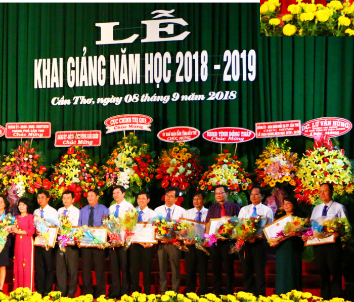
"Tập thể lao động xuất sắc" năm học 2016-2017.

với việc thực hiện chỉ đạo của Thủ tướng “phấn đấu nằm trong top xếp hạng hàng đầu Châu Á và đứng trong top 1.000 trường đại học xuất sắc trên thế giới vào năm 2025” và thực hiện chỉ thị của Bộ GD&ĐT về nhiệm vụ trọng tâm của năm học 2018-2019 là tiếp tục đẩy mạnh thực hiện tự chủ, nâng cao chất lượng đào tạo và NCKH, hỗ trợ khởi nghiệp cho sinh viên; chuẩn hóa, tăng cường hội nhập quốc tế và yêu cầu của cuộc cách mạng công nghiệp 4.0; tăng tỷ lệ sinh viên ra trường có việc làm phù hợp với chuyên ngành đào tạo.