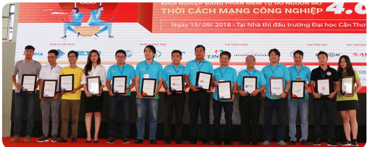
Trao chứng nhận cho các đơn vị tài trợ.