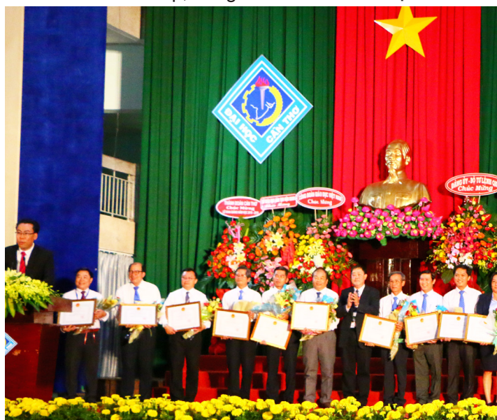
21 tập thể thuộc Trường ĐHCT nhận danh hiệu

Trở thành trường đại học nghiên cứu là mục tiêu hướng tới và nghiên cứu khoa học (NCKH) cũng là hoạt động nổi bật của Trường ĐHCT trong năm học qua. Trường đang triển khai 445 đề tài NCKH các cấp, trong đó có 06 đề tài thuộc