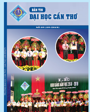
Ảnh bìa: Lễ Khai giảng năm học 2018-2019

In 300 quyển, khổ 19 x 26cm, tại Công ty CP In Tổng hợp Cần Thơ tháng 10/2018.