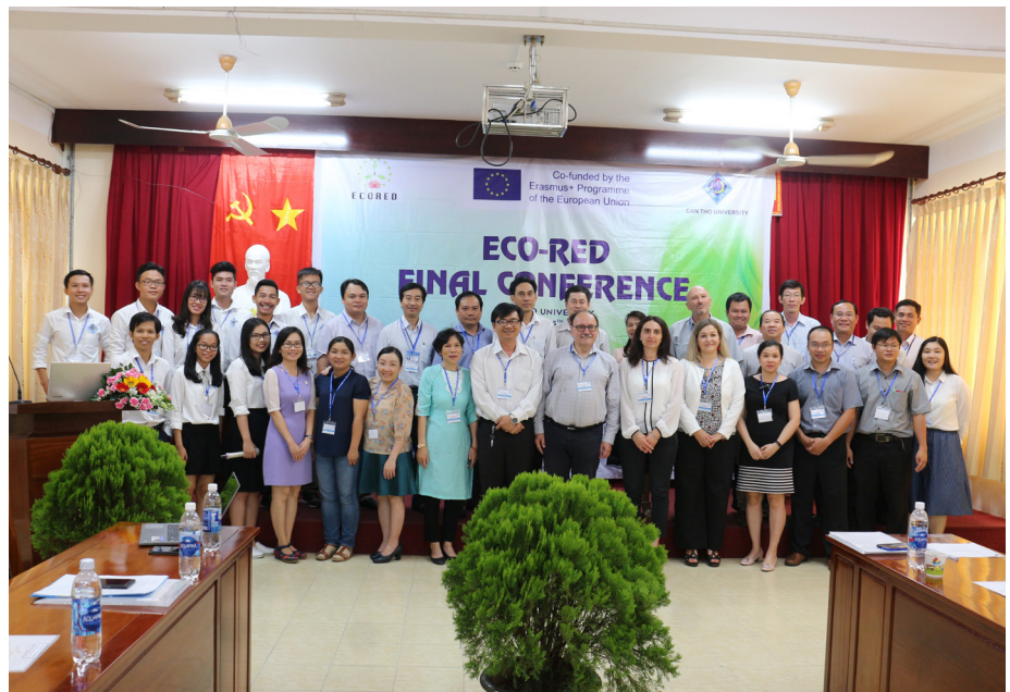
Ảnh lưu niệm tại Hội nghị.

Bologna vào đảm bảo chất lượng đào tạo đại học; tổ chức 05 khóa học cho 90 sinh viên về năng lượng tái tạo; xây dựng Phòng thí nghiệm Năng lượng tái tạo. Phát huy kết quả đạt được từ Dự án, trong thời gian tới, Khoa Công nghệ-Trường ĐHCT sẽ tích hợp 05 khóa học về năng lượng tái tạo vào chương trình giảng dạy nhằm nâng cao hiệu quả và tính bền vững về đào tạo; mở các khóa đào tạo ngắn hạn về năng lượng tái tạo; tăng cường hợp tác với công ty, doanh nghiệp nhằm chuyển giao kỹ thuật về các giải pháp năng lượng tái tạo cho vùng ĐBSCL.