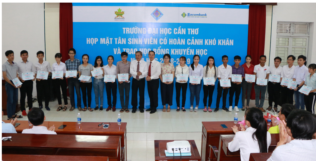
152 tân sinh viên khóa 44 có hoàn cảnh khó khăn nhận học bổng khuyến học ĐHCT năm học 2018-2019.

Thông qua chương trình, tân sinh viên được định hướng rèn luyện những kỹ năng nghề nghiệp và kỹ năng sống cần thiết; tiếp cận các chế độ, chính sách cho các nhóm sinh viên đặc thù; tìm hiểu các chương trình hỗ trợ sinh viên, tư vấn phương pháp tìm kiếm thông tin học bổng, cơ hội việc làm bán thời gian và các hỗ trợ khác từ Nhà trường và các nhà hảo tâm dành cho sinh viên khó khăn.