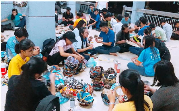
Các bạn TNV tích cực chuẩn bị cho chương trình.

Để chuẩn bị cho chương trình Trung thu lần này, từ những ngày đầu tháng 8, các bạn tình nguyện viên đã tích cực làm lồng đèn bằng giấy, bằng tre, còn có các đơn vị chuẩn bị lồng đèn từ vỏ lon bia. Bên cạnh đó, các bạn còn tích cực chuẩn bị cho chương trình văn nghệ và tranh thủ vận động sự giúp đỡ của quý mạnh thường quân trong và ngoài liên chi.