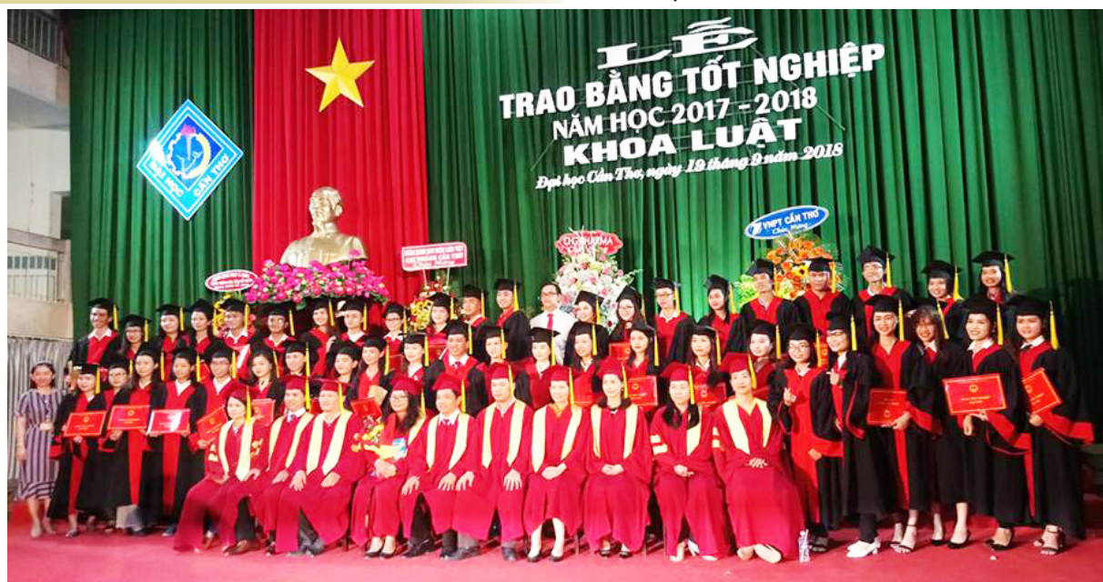
Ảnh lưu niệm của các tân cử nhân với quý thầy, cô giáo.

Tuy nhiên, những điều học được ở Trường mới chỉ là những kiến thức cơ bản, làm nền tảng ban đầu để các tân cử nhân và kỹ sư bước vào đời mưu sinh, lập nghiệp. Nhà trường mong muốn sinh viên Trường ĐHCT sau khi tốt nghiệp giữ vững niềm tự hào là sinh viên Trường ĐHCT, luôn giữ gìn hình ảnh tốt đẹp của sinh viên trường, bên cạnh đó luôn giữ vững tinh thần học tập suốt đời, biết vận dụng những kiến thức đã học vào thực tiễn, để từ thực tiễn tự làm phong phú hơn vốn tri thức của mình. Cánh cửa ĐHCT luôn rộng mở để chào đón cựu sinh viên trở lại Trường tiếp tục theo đuổi con đường học tập, lĩnh hội tri thức ở bậc cao hơn.